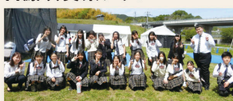
新庄ハーモニーウインズ (新庄吹奏楽クラブ)