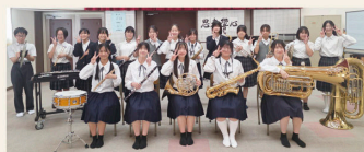
白鳳吹奏楽クラブ